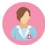
EDUCATORI / TECNICI DELLA RIABILITAZIONE Camice celeste