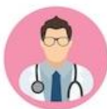
MEDICI camice bianco

Il colore e la foggia delle divise consentono di ricondurre gli operatori ad un gruppo professionale.