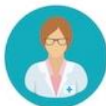
ASSISTENTE SOCIALE camice bianco