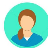
OPERATORI SOCIO SANITARI Casacca e pantalone blu