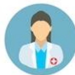
PSICOLOGI camice bianco